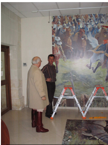
Le président et « l'artiste »

La réalisation des murs de l'accueil a été confiée à la société « Cré imaj ».