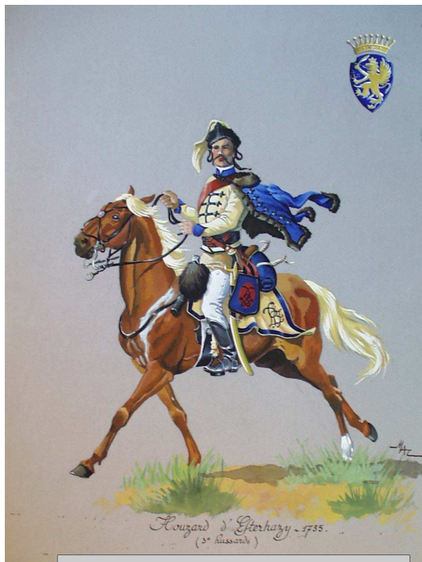
Houzar d'Esterhazy (3 ème Hussards) - 1755 Collection DUGUÉ MAC CARTHY

Les travaux avancent, mais votre soutien financier est indispensable pour mener à son terme une muséographie et une scénographie de qualité.