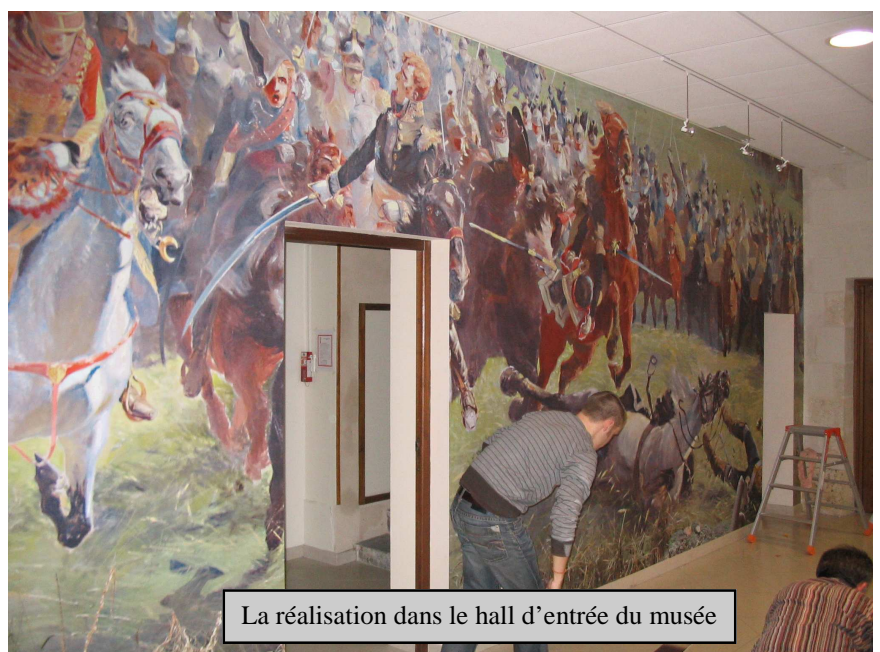
La réalisation dans le hall d'entrée du musée