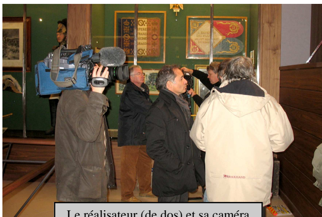
Le réalisateur (de dos) et sa caméra

Le scénario, dont le thème général est la Ville de Saumur vue sous différents aspects, incluait une rencontre de ces deux protagonistes au musée de la cavalerie.